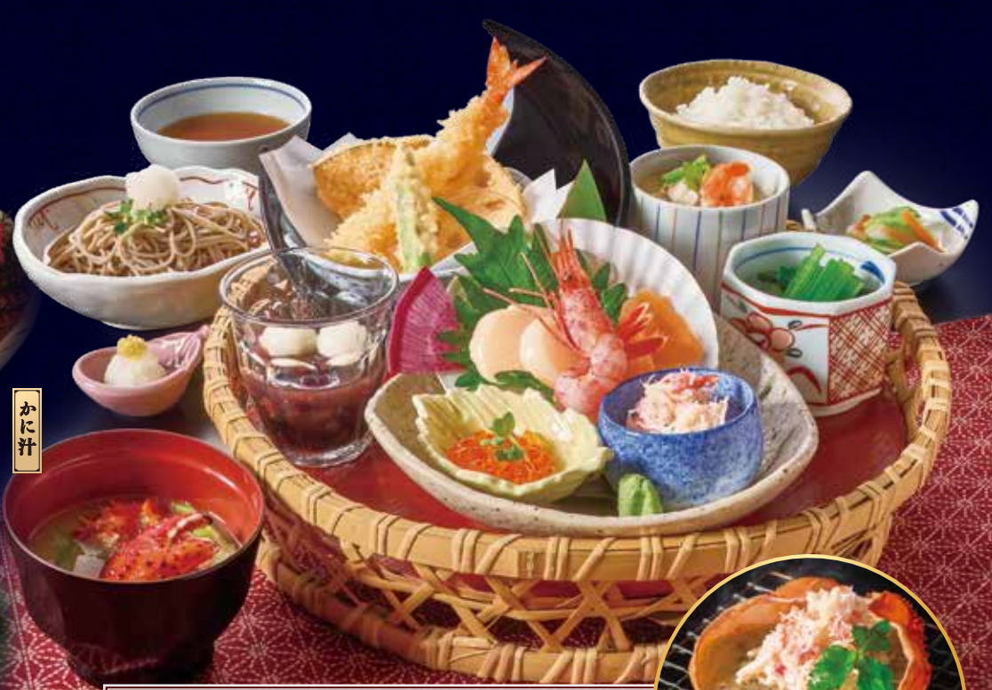
北海道味めぐり御膳 (写真) ・いくら・ホタテ・花咲ガニ(かに汁) ・北海道産小豆使用ぜんざい・北海道産そば粉 2,291円(税込2,520円) お得!! かに味噌甲羅焼き付き 2,791円(税込3,070円)