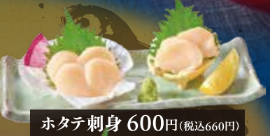
ホタテ刺身 600円(税込660円)