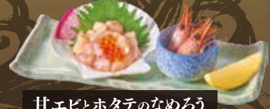
甘エビとホタテのなめろう 619円(税込680円)

札幌名物「スープカレー」 花咲ガニの旨味と辛味を香りのスパイスでつりめんに風。ごはんやパンに添えて食べるのが札幌流。