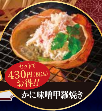
セットで 430円(税込) お得!! かに味噌甲羅焼き