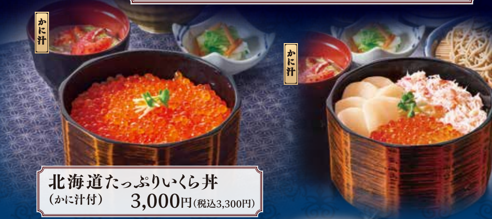
北海道たっぷりいくら丼(かに汁付) 3,000円(税込3,300円)