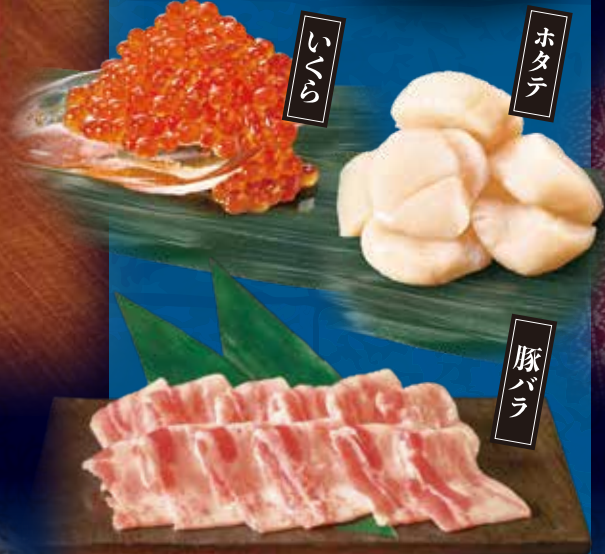
北の三色丼(かに汁付)と麺 (写真) ・いくら・ホタテ ・花咲ガニ(かに汁) ・北海道産そば粉 2,200円(税込2,420円) 北の三色丼(かに汁付) 2,000円(税込2,200円)