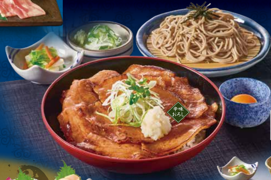
炙り豚丼と麺 (写真) ・豚バラ ・北海道産そば粉 1,591円(税込1,750円)