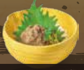
おつまみかに味噌 528円(税込580円)