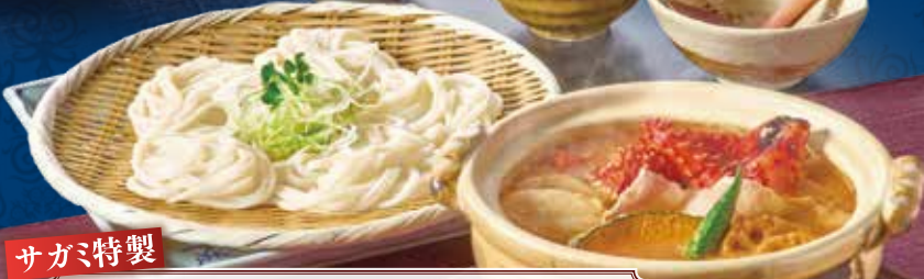
サガミ特製 花咲ガニ仕立てのスープカレー (写真) ・花咲ガニ ・じゃがいも ・豚バラ (細うどん・ごはん付き) 1,491円(税込1,640円)

札幌名物「スープカレー」 花咲ガニの旨味と辛味を香りのスパイスでつりめんに風。ごはんやパンに添えて食べるのが札幌流。