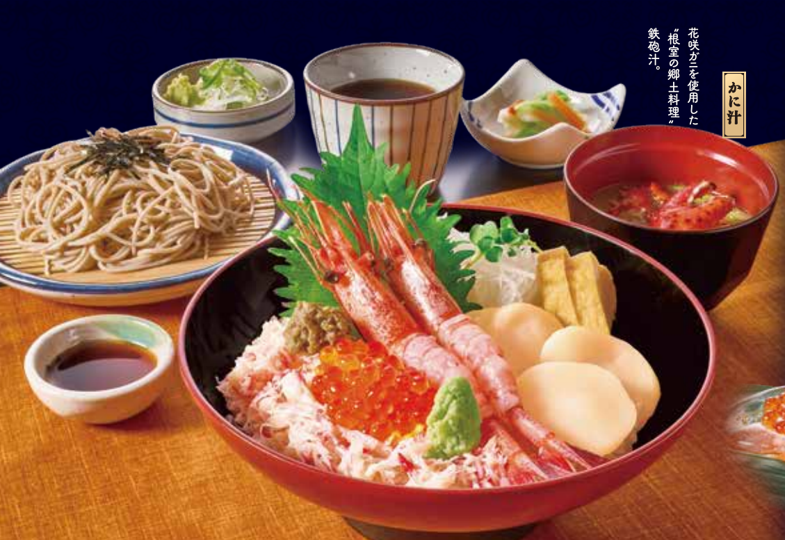
北海道と北のめぐみ丼(かに汁付)と麺 (写真) ・いくら・ホタテ・花咲ガニ(かに汁) ・本ずわい蟹・かに味噌・南蛮海老 1,991円(税込2,190円) 北海道と北のめぐみ丼(かに汁付) 1,791円(税込1,970円)