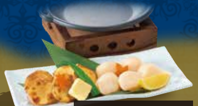
ホタテバター陶板焼き 1,319円(税込1,450円)