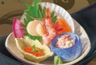
北海お刺身盛合せ 1,200円(税込1,320円)