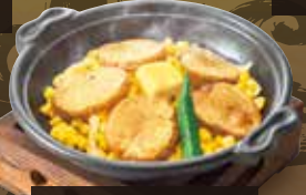
じゃがバターコーン 473円(税込520円)