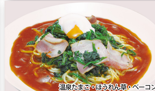
温泉たまご・ほうれん草・ペーコン