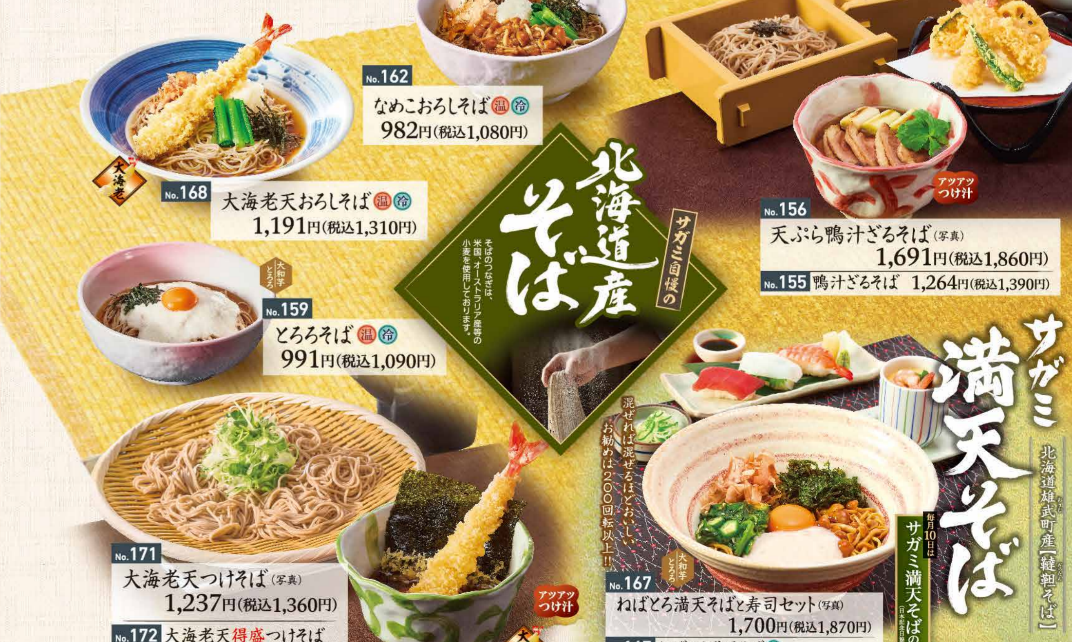
No.162 なめこおろしそば 982円(税込1,080円)