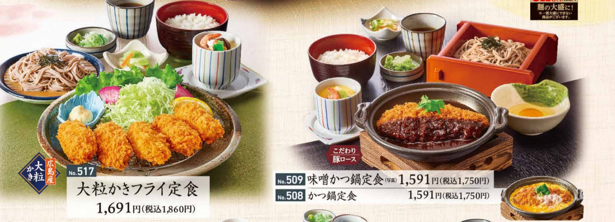
No.517 大粒 大粒かきフライ定食 1,691円(税込1,860円)

彩り豊かな素材自慢、 味自慢のお料理の数々を ごゆくり お楽しみください。 ごはん大盛 60円(税込) ごはん少なめ 20円(税込)引き 220円(税込)で 麺の大盛に! ※一席大盛にできない 商品がございます。