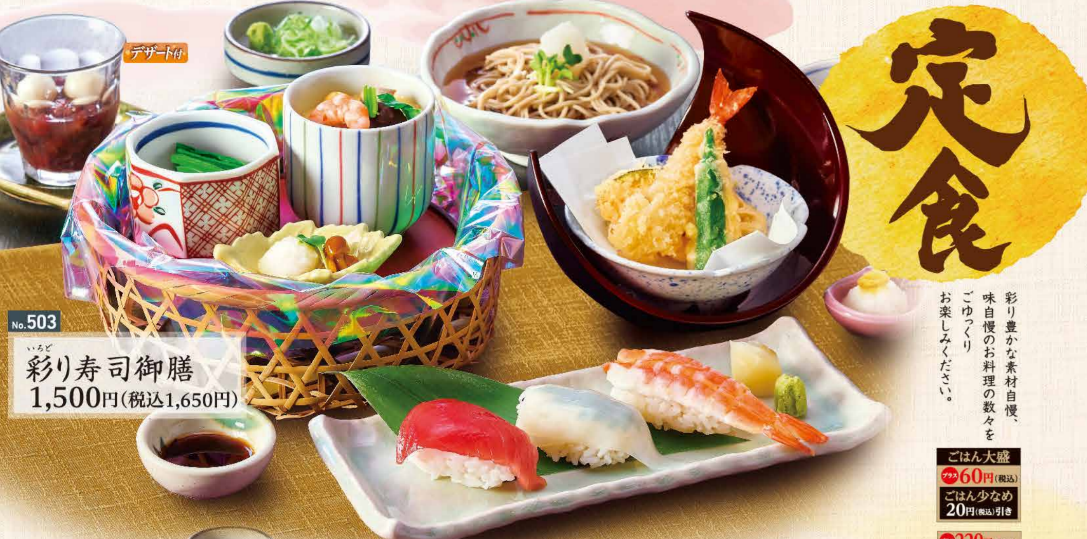
No.503 いろど 彩り寿司御膳 1,500円(税込1,650円)

彩り豊かな素材自慢、 味自慢のお料理の数々を ごゆくり お楽しみください。 ごはん大盛 60円(税込) ごはん少なめ 20円(税込)引き 220円(税込)で 麺の大盛に! ※一席大盛にできない 商品がございます。