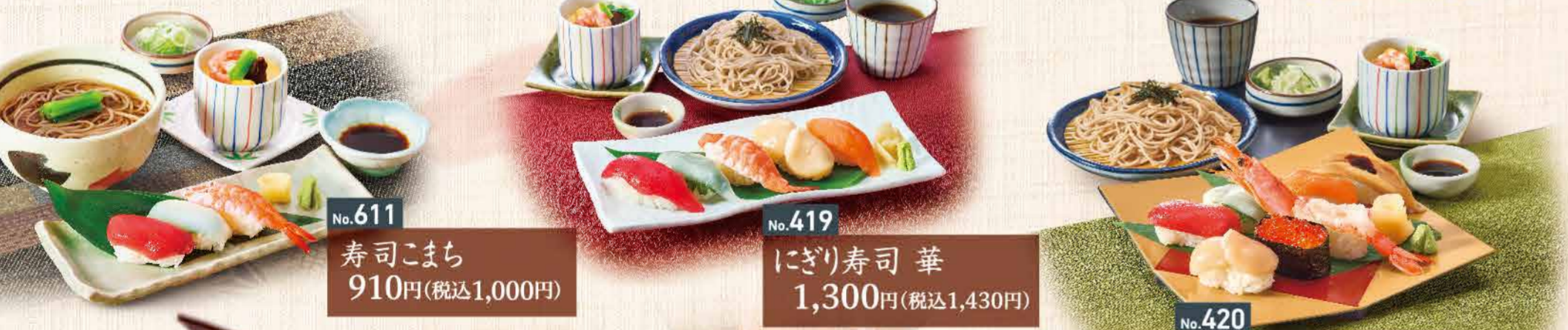
No.611 寿司こまち 910円(税込1,000円)