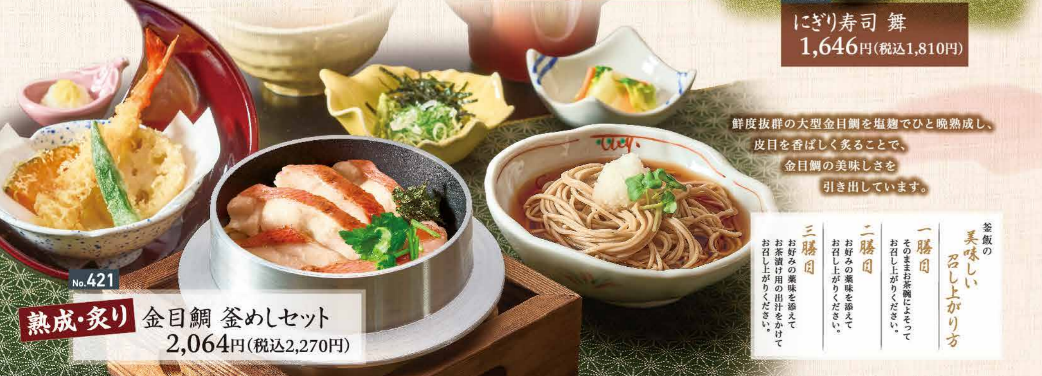
No.421 熟成・炙り 金目鯛 釜めしセット 2,064円(税込2,270円)

鮮度抜群の大型金目鯛を塩麴でひと晩熟成し、 皮目を香ばしく炙ることで、 金目鯛の美味しさを 引き出しています。