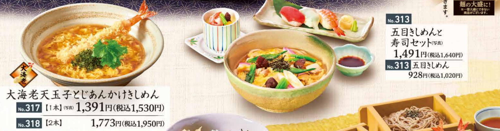
大海老 大海老天玉子とじあんかけきしめん No.317【1本】(写真) 1,391円(税込1,530円) No.318【2本】 1,773円(税込1,950円)