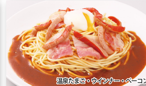
温泉たまご・ウインナー・ペーコン