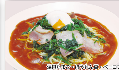
温泉たまご・ほうれん草・ペーコン