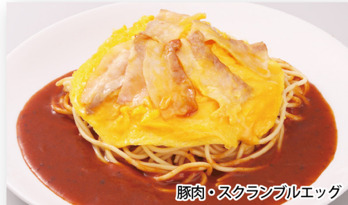
豚肉・スクランブルエッグ