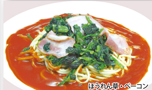
ほうれん草・ペーコン