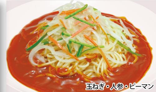
玉ねぎ・人参・ピーマン