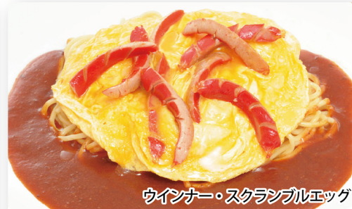
ウインナー・スクランブルエッグ