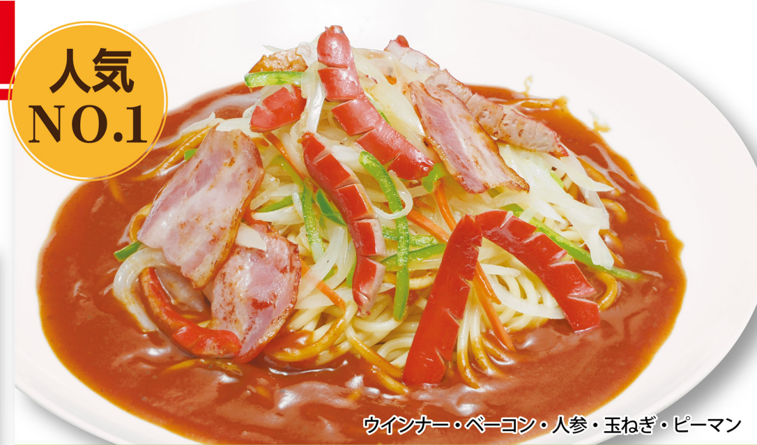
ウインナー・ペーコン・人参・玉ねぎ・ピーマン