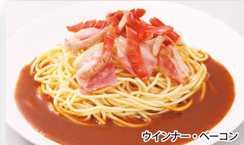
ウインナー・ペーコン