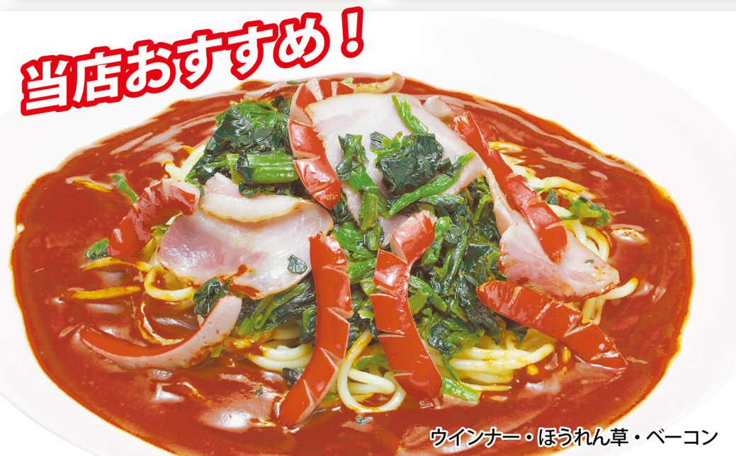
ウインナー・ほうれん草・ペーコン