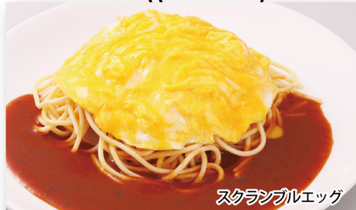
スクランブルエッグ